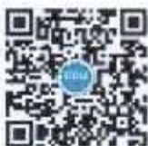
QR Code Zoom meeting