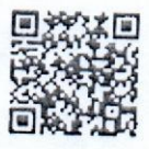
QR Code ลงทะเบียน

จึงเรียนมาเพื่อโปรดพิจารณาและให้ความอนุเคราะห์ประชาสัมพันธ์บุคลากรในสังกัดของท่านเข้าร่วมสัมมนาวิชาการครั้งนี้ด้วย จะขอบพระคุณยิ่ง