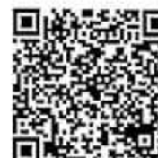
ตัวอย่าง